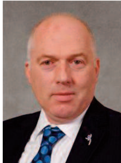
Y Cyngorydd Hugh Evans OBE, Arweinydd Cyngor Sir Ddinbych

I'r diben hwn, bydd y Cyngor yn gweithio gyda phartneriaid er mwyn sicrhau fod cynllunio ieithyddol yn ddeiliant mwy strategol, er mwyn sicrhau bod yr holl bartneriaid yn gweithio gyda'i gilydd tuag at yr un nod: gwarchod a chyfoethogi'r Iaith Gymraeg yn Sir Ddinbych.